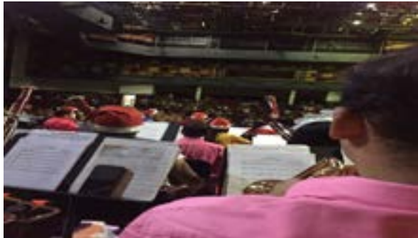
El 9 de diciembre la Coral Falcón ofreció un concierto en el Teatro Armonía.

La Coral Falcón cierra en positivo las actividades del 2022 con cuatro magistrales conciertos navideños