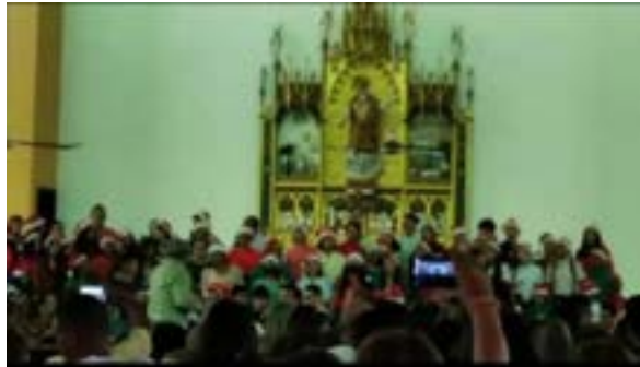
La Coral Falcón durante su tradicional concierto navideño con la participación de la Orquesta Sinfónica de Falcón, en la Iglesia San Juan Bosco.

Prosiguió el domingo 11 en la Iglesia San Antonio. Y, el miércoles 14 del mes en curso ofreció un concierto para la Comunidad de la Santísima Trinidad de Bobare, en la Antigua Cancha del Padre Carlos.