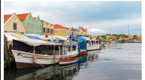
Nuevamente las embarcaciones de La Vela de Coro transportarán mercancía al muelle de Curazao.

-Curazao, 3 de abril (por aire y mar), Bonaire 3 de abril (por mar) y Aruba 1 de mayo (por mar).