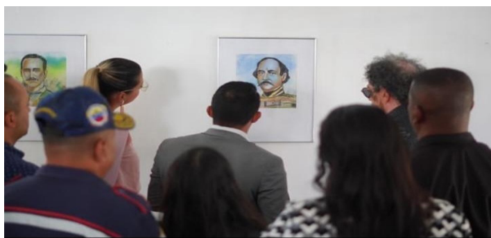
Publico en la Exposición “Una Visión Federalista”.

de las artes plásticas más innovadores de Falcón. Formado en la escuela de Artes Plásticas ‘Tito Salas’ de Coro, tiene dominio de las técnicas de la pintura y la escultura.