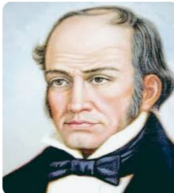
Hoy es más válido que nunca, el pensamiento emancipador de Simón

8. Planteó ideas que Chávez rescato, en el ya nombrado Libro Azul y después plasmado en la Constitución de 1999, básicamente referido a la búsqueda del bien común, cómo tarea de todo hombre republicano, pero además, impulsó lo que podemos llamar la "pedagogía del ejemplo", que es una acción ética coherente, destinada a un hacer comprometido con el logro del bienestar para todos. Es