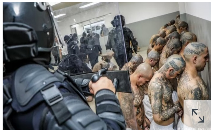
el traslado de unos 2.000 pandilleros al Centro de Confinamiento del Terrorismo, una megacárcel de reciente construcción