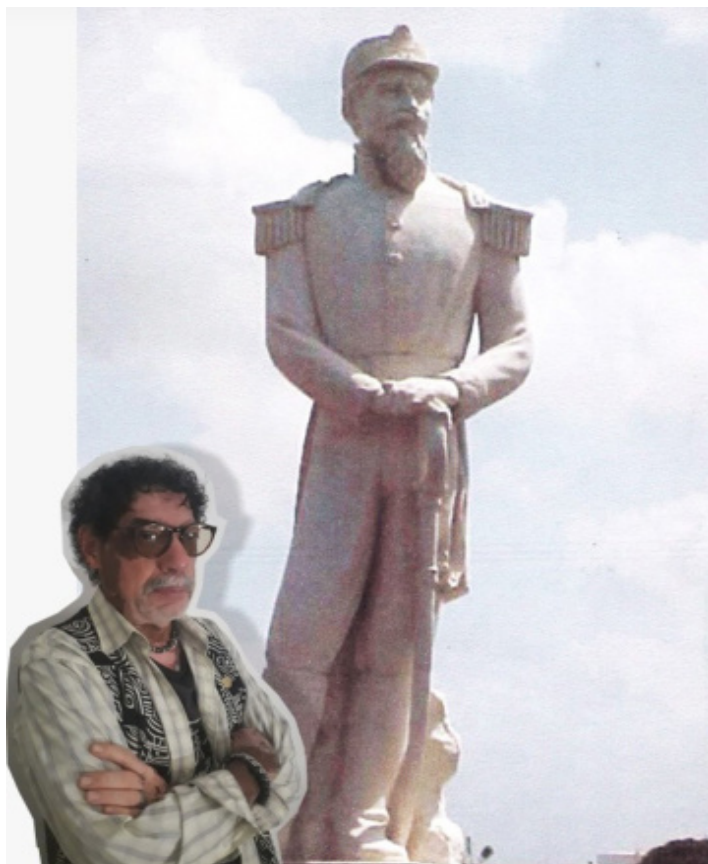
En la gráfica se aprecia al artista frente a una de sus magníficas esculturas, la del héroe federalista Tirso Salavarría.

Según el escritor Miguel Ángel Paz “Curiel es uno de los creadores