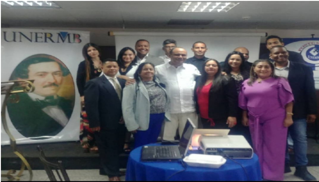
Los participantes y facilitadores de La Investigación en el Contexto de la Formación Doctoral, de la Unermb.