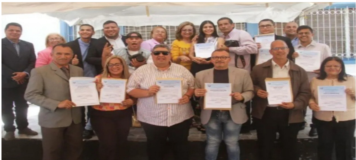
Los galardonados con los premios municipales de periodismo que otorga ConceMiranda.