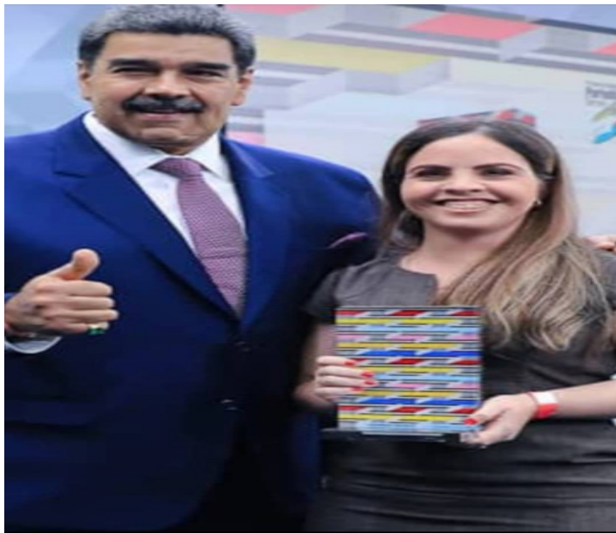
El presidente Nicolás Maduro entrega el Premio Nacional de Periodismo mención Opinión a Ana Cristina Bracho Vallarino.

Hasta ella y todo su grupo familiar, nuestras palabras de felicitación de todo el equipo de CORO Hoy.