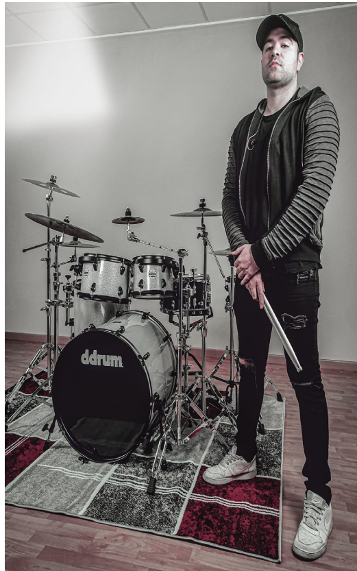
Dios me tiene en España pero listo para perseguir el sueño que puso en mí, aunque la oportunidad se diese en otro lado.

-Mi próximo reto es sacar mi primer álbum en solitario. Es otro de los sueños que quiero alcanzar y ya estoy dando pasos en esa dirección rodeándome de un excelente equipo para producir este gran proyecto.